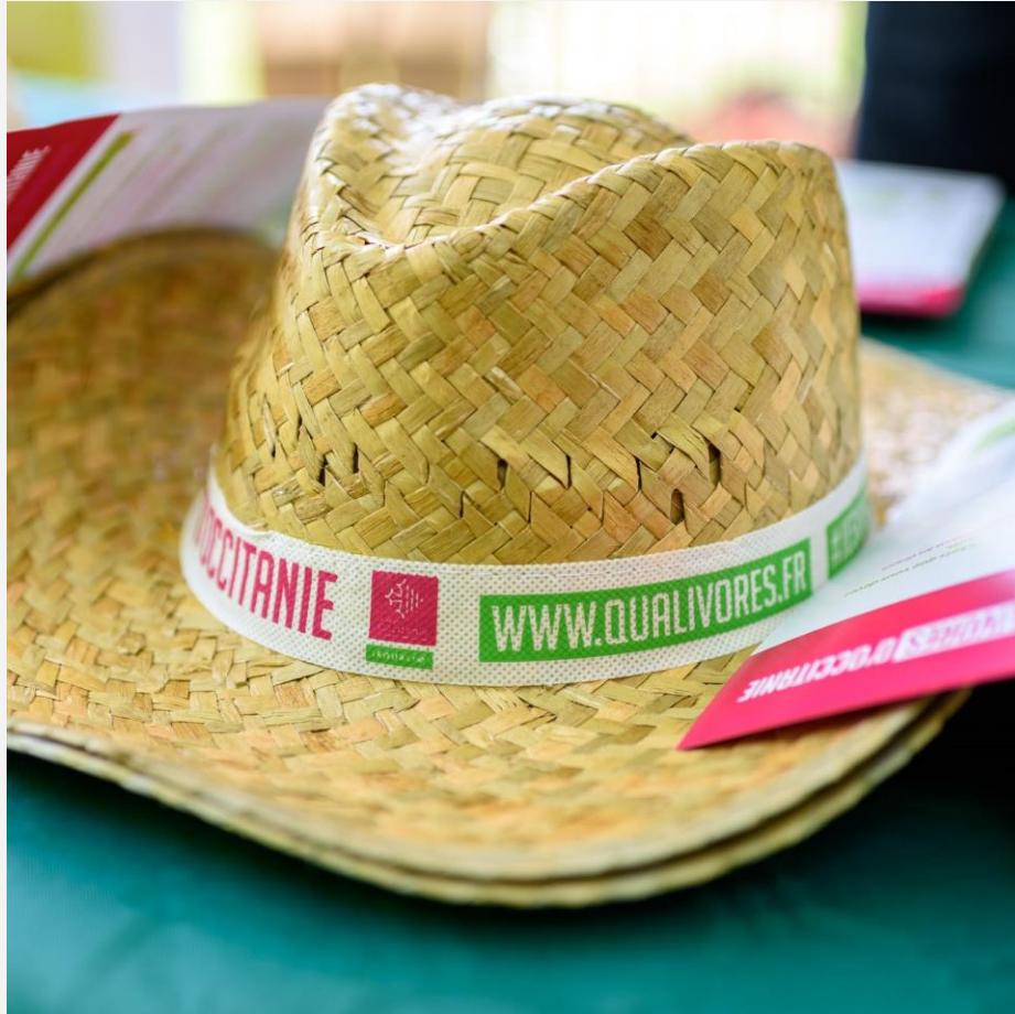
Pique-nique des Qualivores